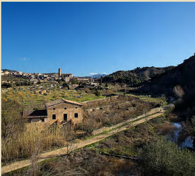
Molí dels Frares, el riu Siurana i Poboleda al fons

abast, i l'arma més poderosa de què disposaven no era de foc, sinó de fe. ¿En què consistia? Elemental: en negar l'absolució a qui no anés a moldre al molí dels cartoixans, que era el molí de Bardina. L'al·legació dels veïns de Poboleda ho deixa clar en detallar que un predicador passavolant els va arribar dir el següent: «Aixís dich que si no prometen anar al Molí de Bardina, ni jo ni los meus Companys no ne absolerem cap, que estau condemnats y no vos salvareu.» Condemnació eterna per una quartera de blat. Final de la història: l'arquebisbat de Tarragona va cridar a l'ordre la cartoixa per tal que «se abstuviese en lo sucesivo de medios tan irregulares». Amén.