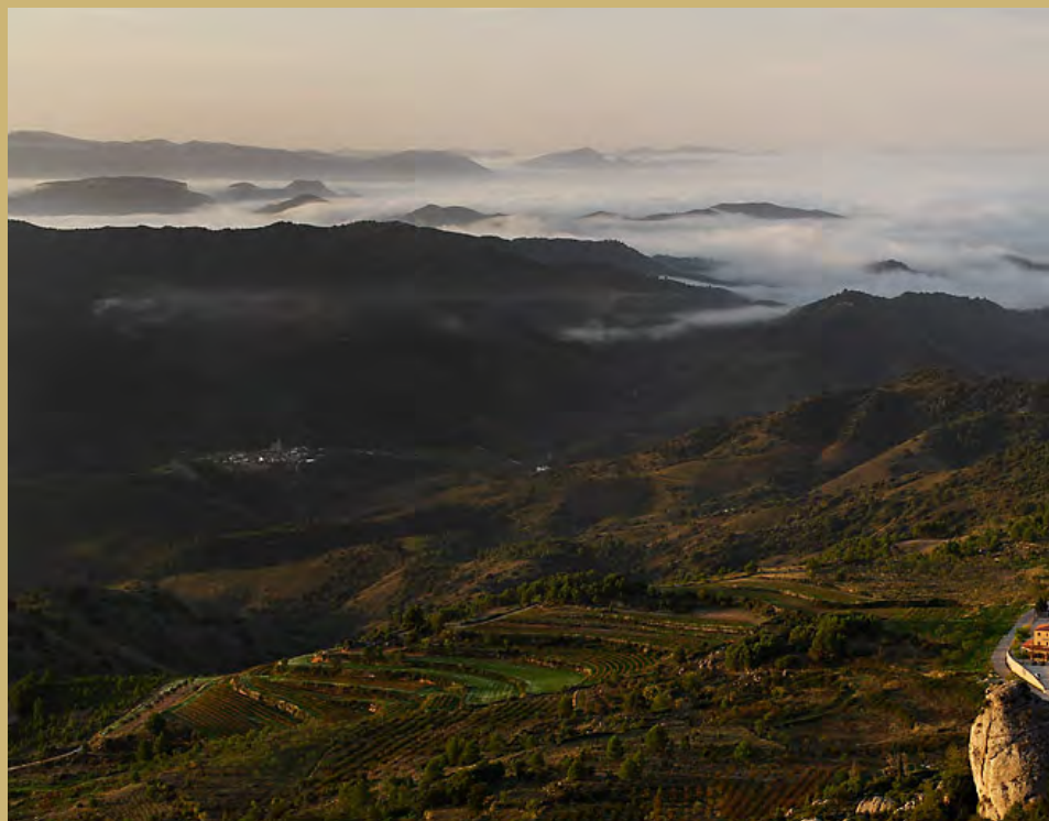
La Morera de Montsant des de la serra Major, i Poboleda al fons