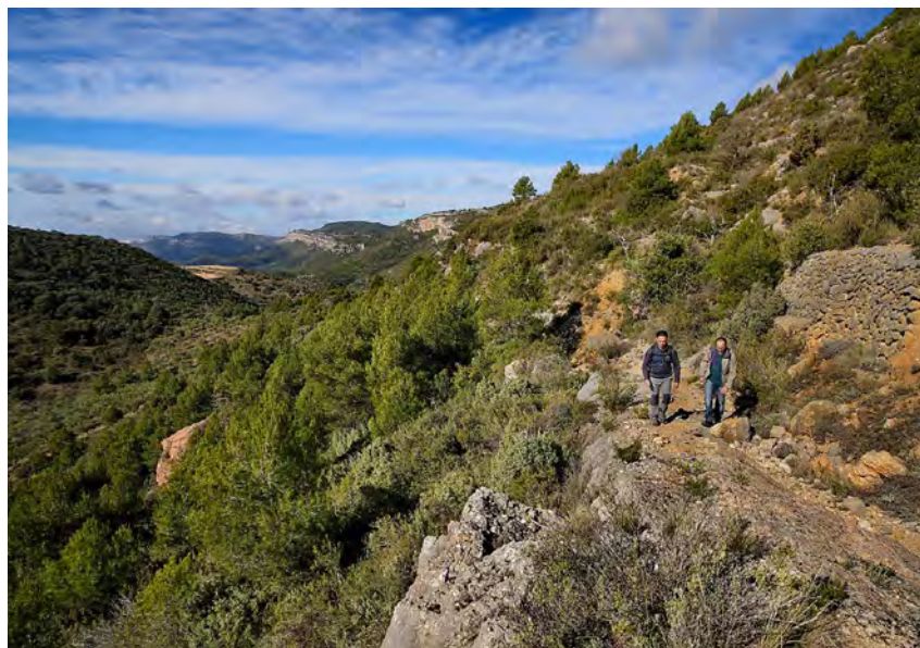
Camí antic de la Morera a Cabacés

seus guies, els seus horaris, els seus opuscles, els seus turistes, els seus guàrdies, tot i que d'això no en fa tant. Fins a principis dels anys noranta del segle XX, la que fou primera cartoixa de la península Ibèrica —o el que en quedava, que era ben poca cosa— no passava de ser un racó de regust romàntic, on les hores i els matolls deixaven entreveure carreus, columnes i arquitraus. Un indret sense clau, obert a tothom, però propietat de particulars després que l'any 1838 l'Estat se la vengués com qualsevol altra propietat —com si fos un coster o una casa més— arran de la desamortització de Mendizábal.